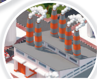
Proyek Minyak & Gas