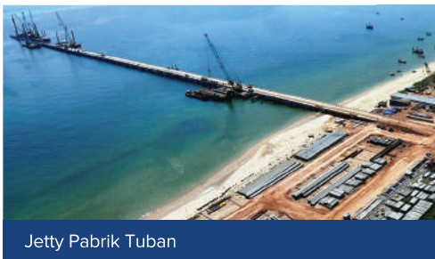
Jetty Pabrik Tuban