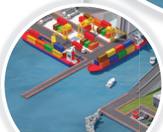
Pelabuhan & Dermaga