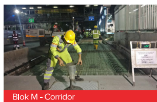
Blok M - Corridor