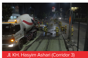
Jl. KH. Hasyim Ashari (Corridor 3)