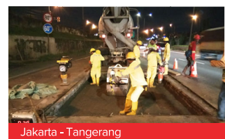
Jakarta - Tangerang