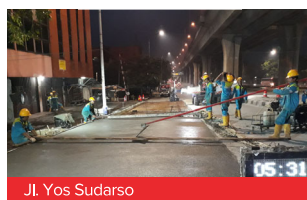
Jl. Yos Sudarso