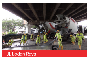
Jl. Lodan Raya