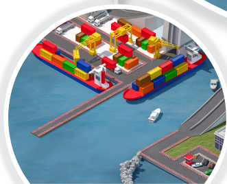
Pelabuhan & Dermaga