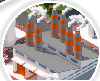
Proyek Minyak & Gas