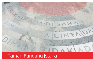
Taman Pandang Istana