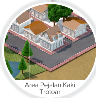
Area Pejalan Kaki Trottoar