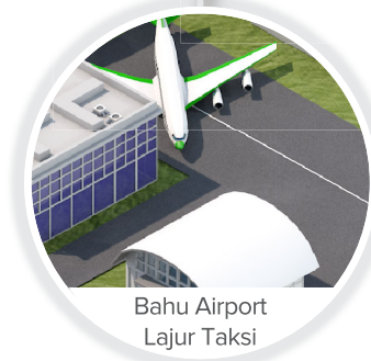
Bahu Airport Lajur Taksi