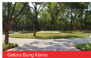
Gelora Bung Karno